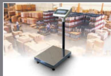
■ для напольных весов