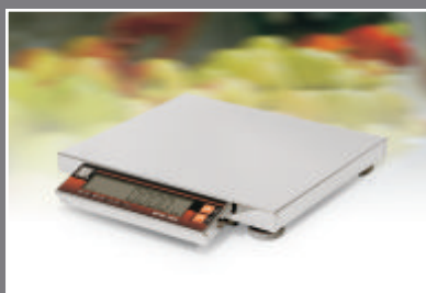
■ для фасовочных весов