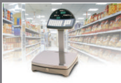
■ для торговых весов